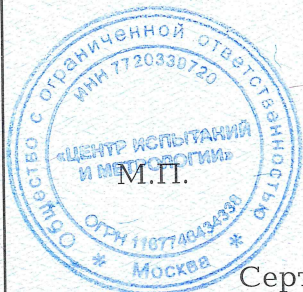
Схема сертификации: Зс.