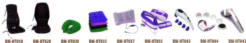
BM-NT010 BM-NT020 BM-NT030 BM-NT035 BM-NT037 BM-NT055 BM-NT043 BM-NT044 BM-NT042

Предлагаем Вашему вниманию серию массажёров для тела «Технологии Здоровья»